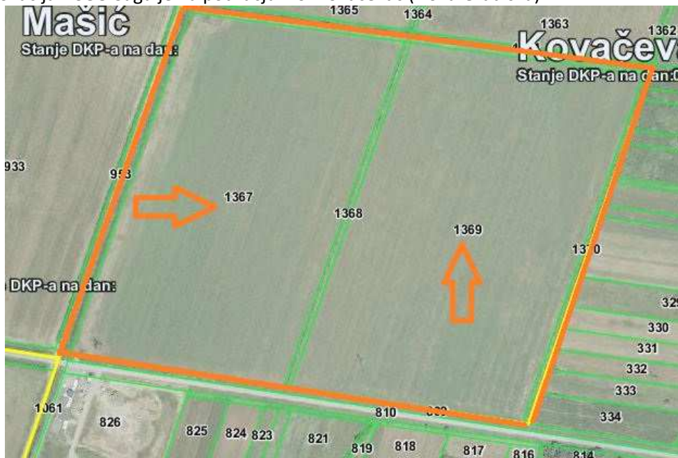
Slika 2: Lokacija RCGO Šagulje na području k.o. Kovačevac (Nova Gradiška)

Lokacija je definirana u Prostornom planu Grada Nove Gradiške, kao i u županijskom Prostornom planu za Županijski/Regionalni centar za gospodarenje otpadom, a u državnom planu gospodarenja otpadom je označena kao lokacija budućeg Regionalnog centra za gospodarenje otpadom.